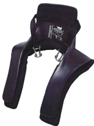
FIA Standard 8858-2010

FIA Standard 8858-2002 et FIA Standard 8858-2010